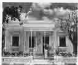
Vista Pública para Plan de Protección Ambiental Pag. 5