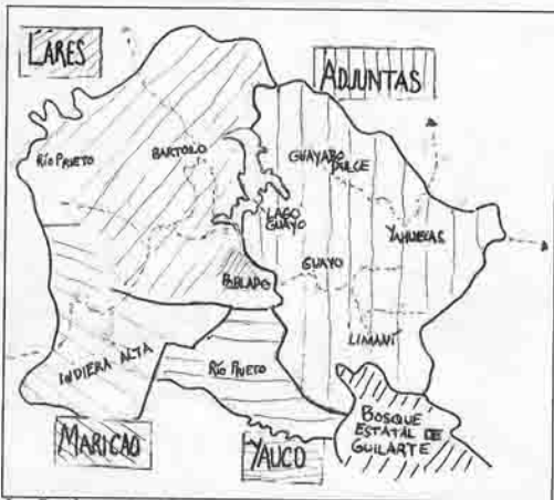
Los Barrios, según el Plan Especial para el Desarrollo de Castañer