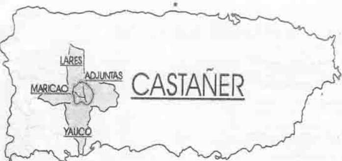
Mapa de la ubicación de Castañer